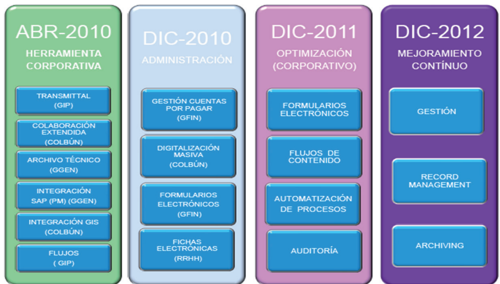
El proyecto de DCL Consultores para Colbún se divide en 4 fases, de las que la primera ha concluido con éxito.

Requerimientos generales. Colbún necesitaba contar con una plataforma corporativa de gestión de documental para soportar la