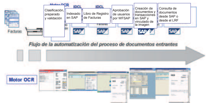
Flujo de los documentos en el LRF integrado al motor de OCR

El Libro de Registro de Facturas de Proveedores provisto por DCL Consultores es una herramienta que permite automatizar las facturas recibidas desde que las mismas son procesadas por el motor de OCR, subiendo datos y documentos a SAP para su procesamiento automático.